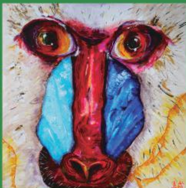
怒っているマンドリル