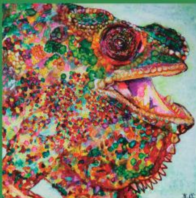
おしゃれなパンサーカメレオン