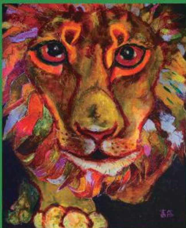
ライオン - どこまでも走れ