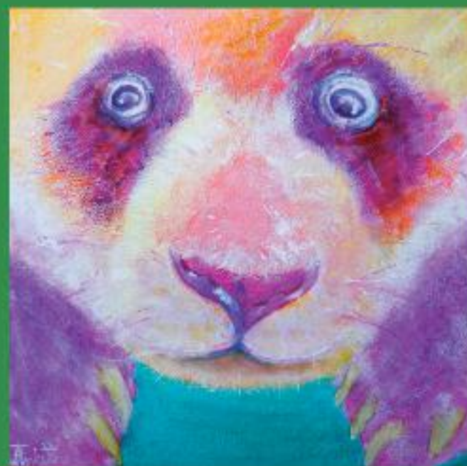
日なたぼっこをしているパンダ